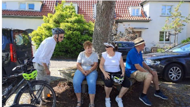
Foto: Fahrradtour August 2024

Treffpunkt: Samstag, 30. Mai 2026, 14 Uhr am Marktplatz in Brück Picknickkorb nicht verges-