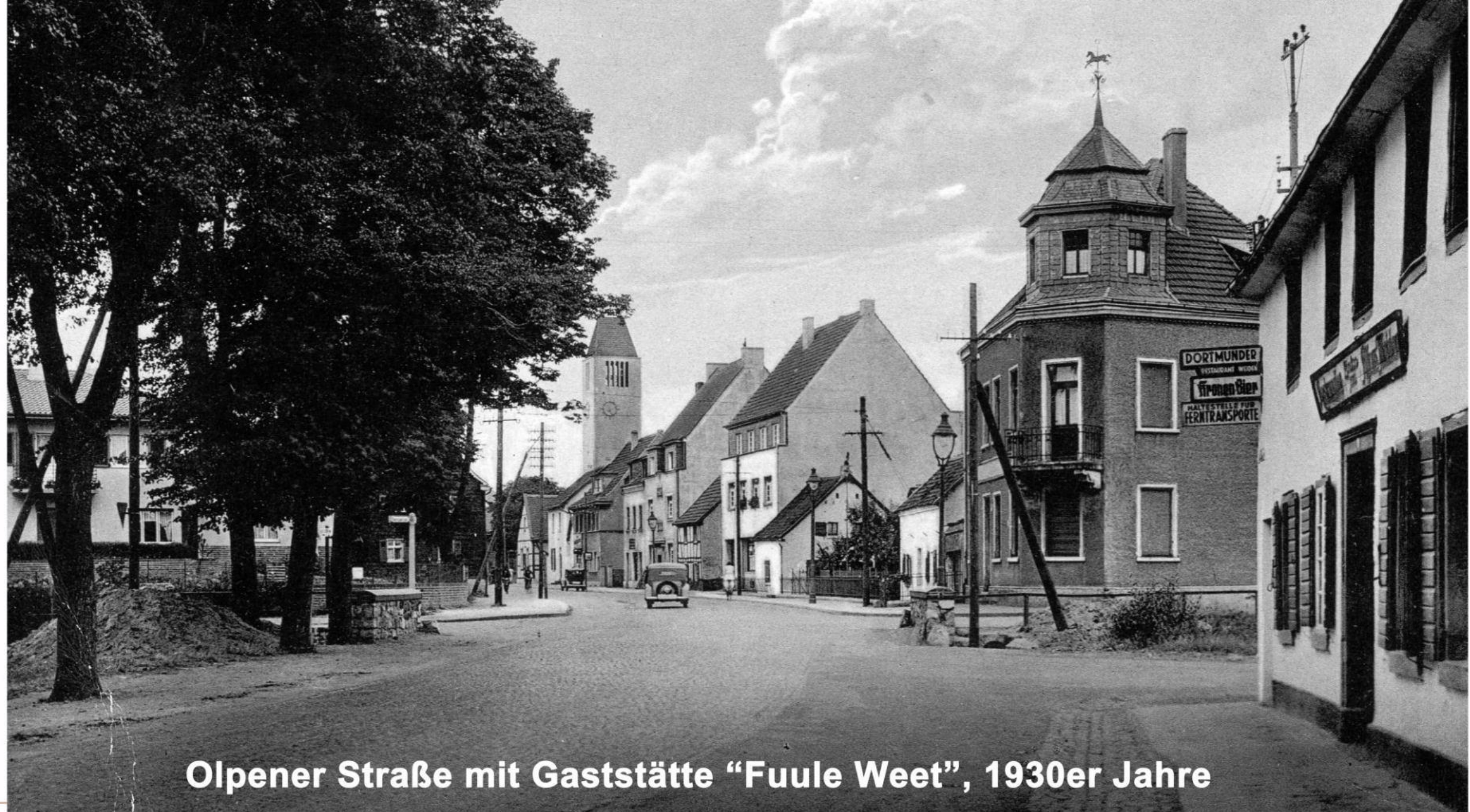
Olpener Straße mit Gaststätte "Fuule Weet", 1930er Jahre