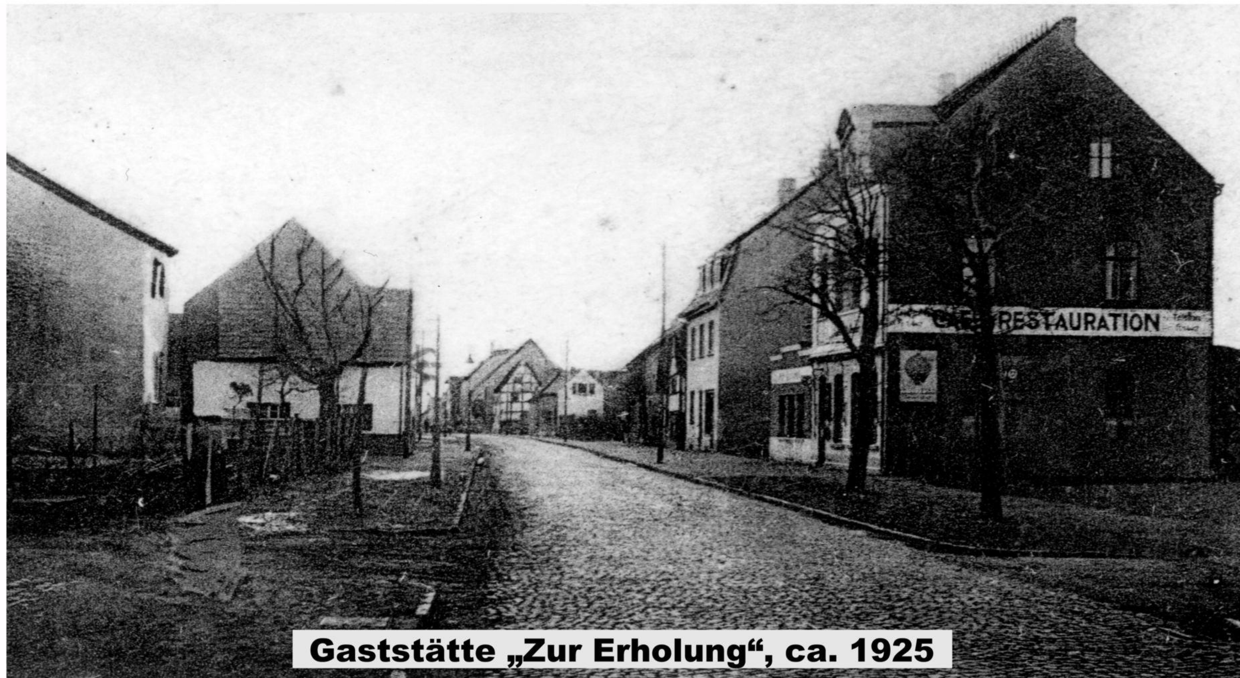
Gaststätte „Zur Erholung“, ca. 1925