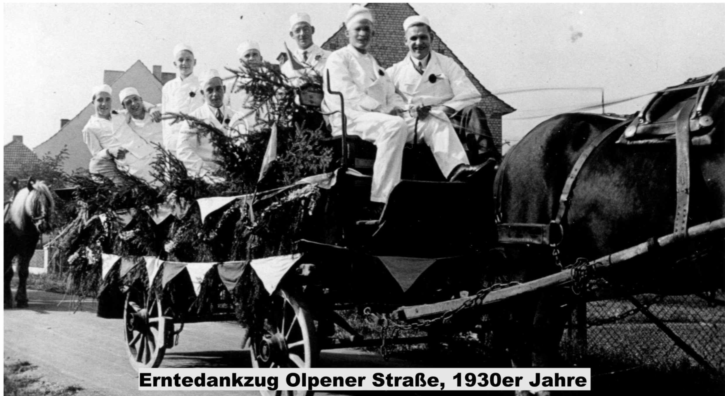
Erntedankzug Olpener Straße, 1930er Jahre