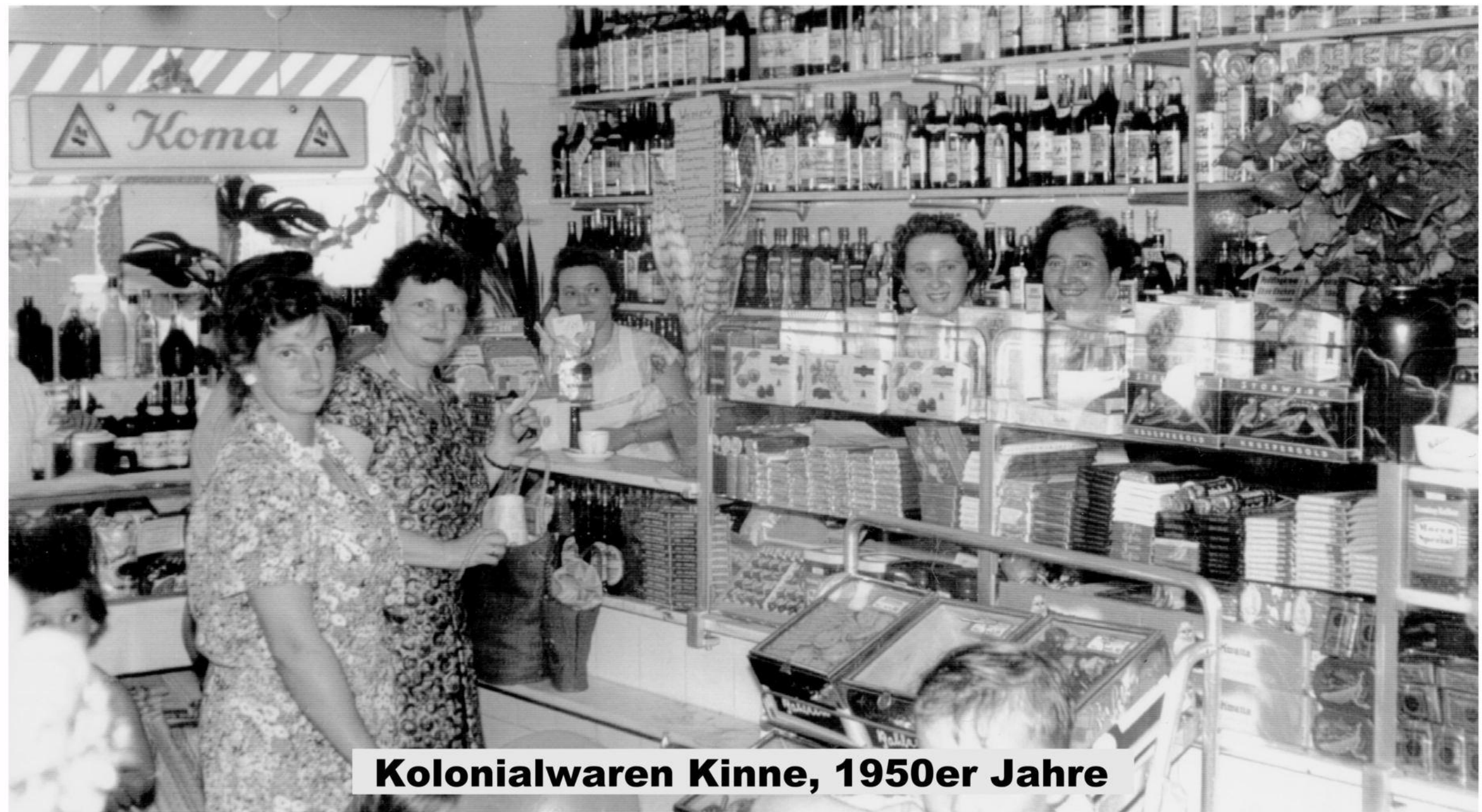
Kolonialwaren Kinne, 1950er Jahre