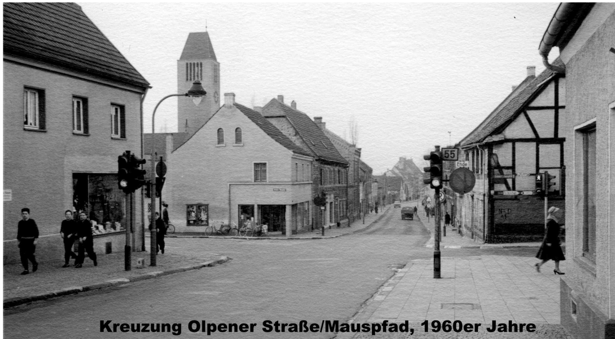
Kreuzung Olpener Straße/Mauspfad, 1960er Jahre