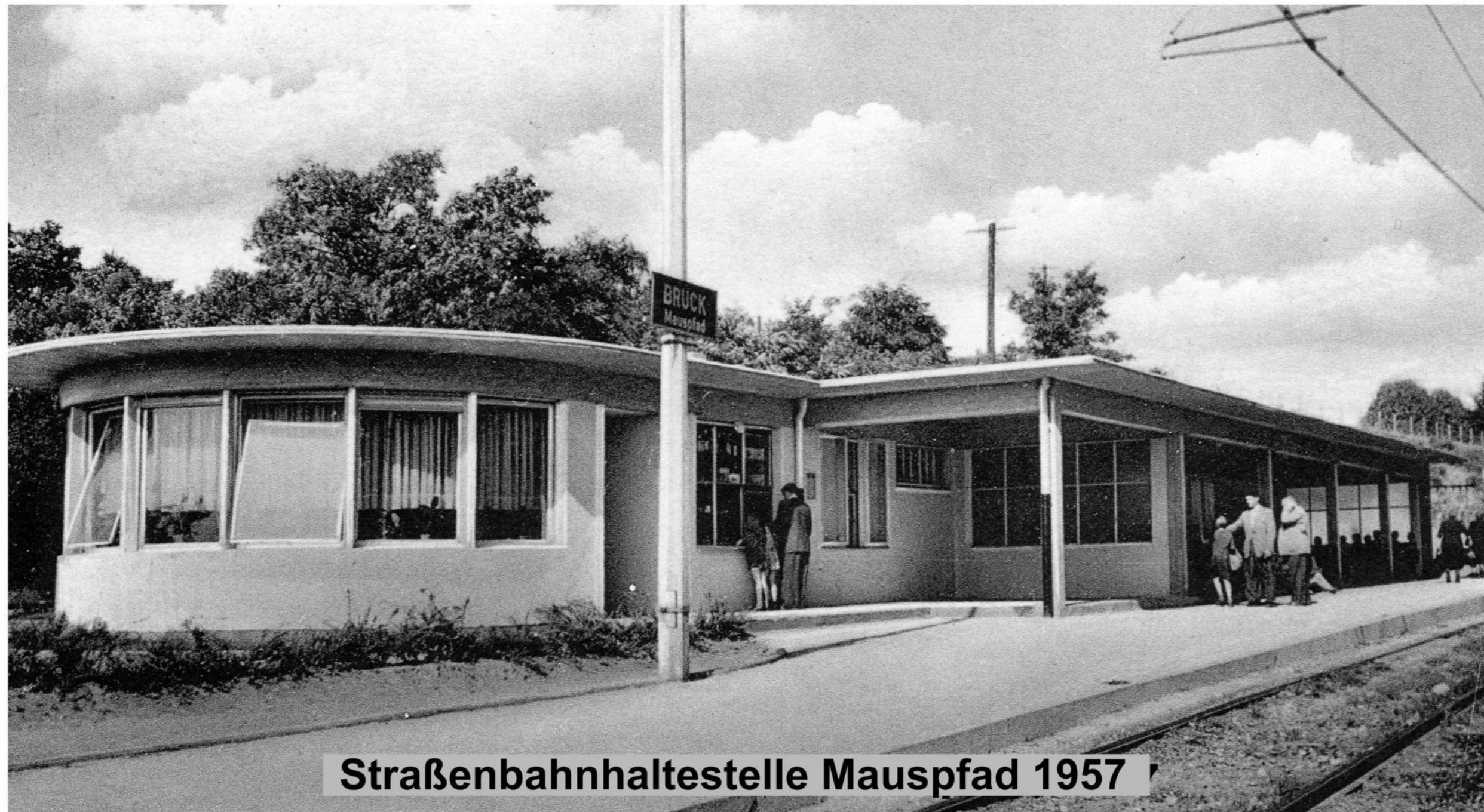
Straßenbahnhaltestelle Mauspfad 1957