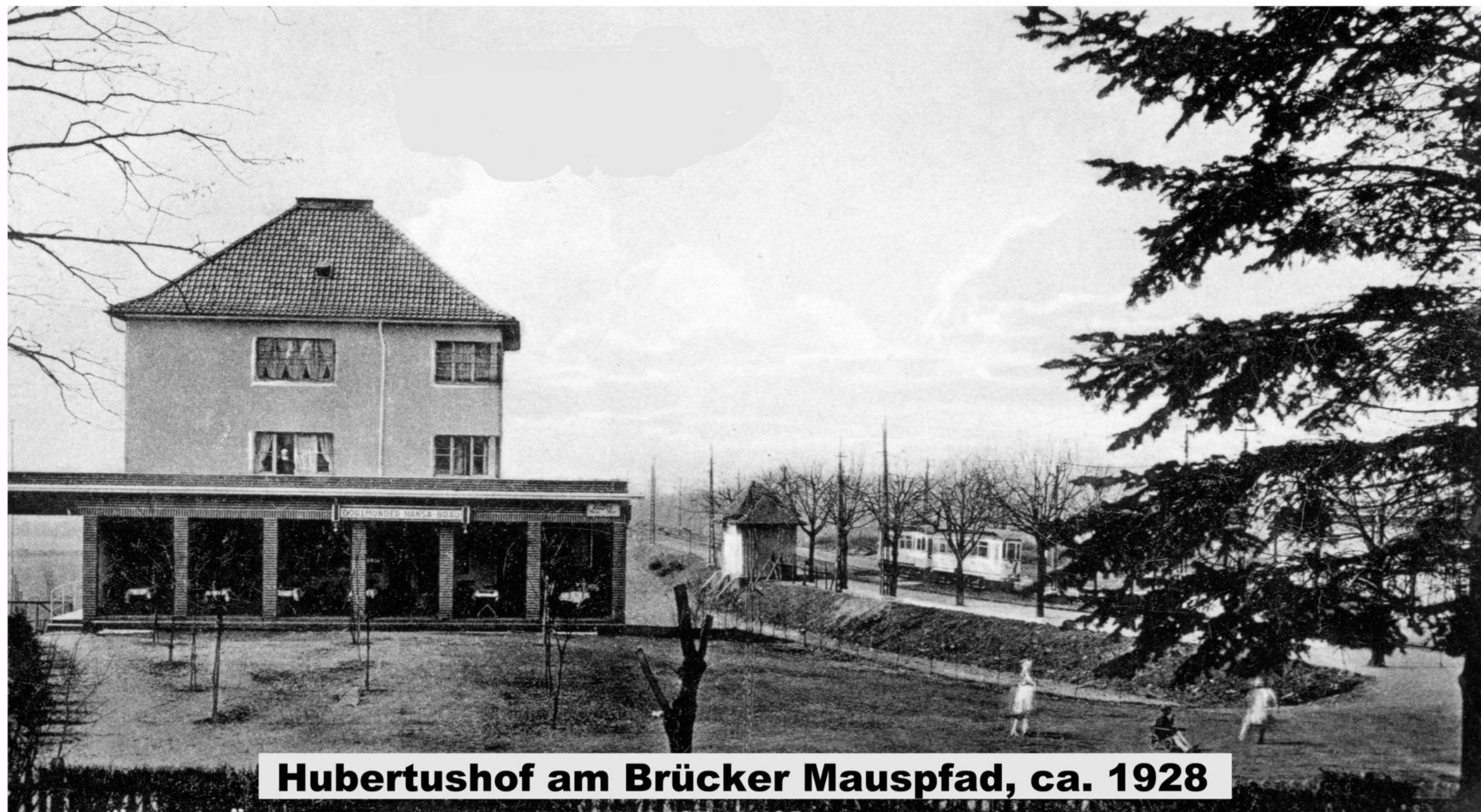
Hubertushof am Brücker Mauspfad, ca. 1928