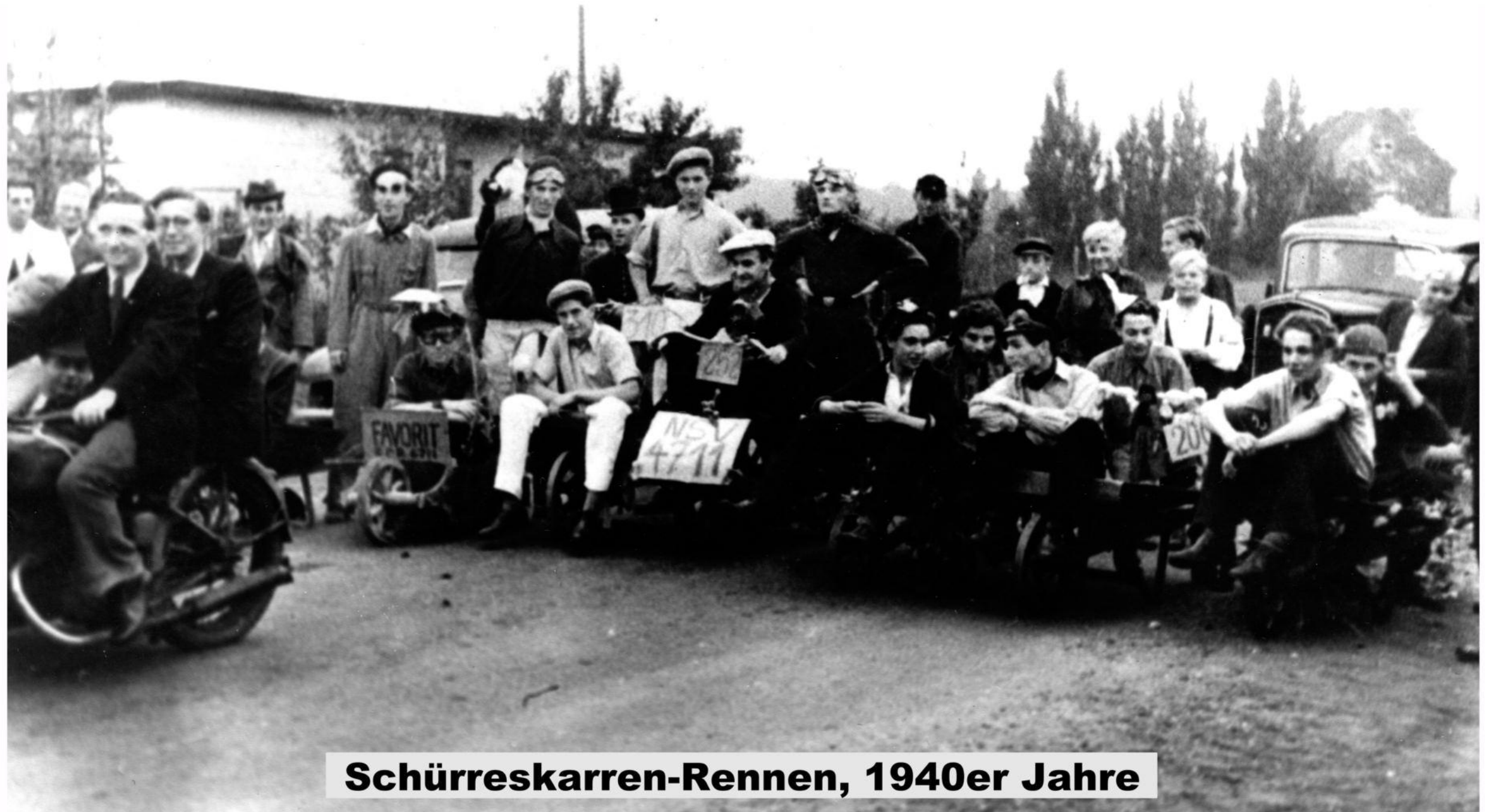
Schürreskarren-Rennen, 1940er Jahre