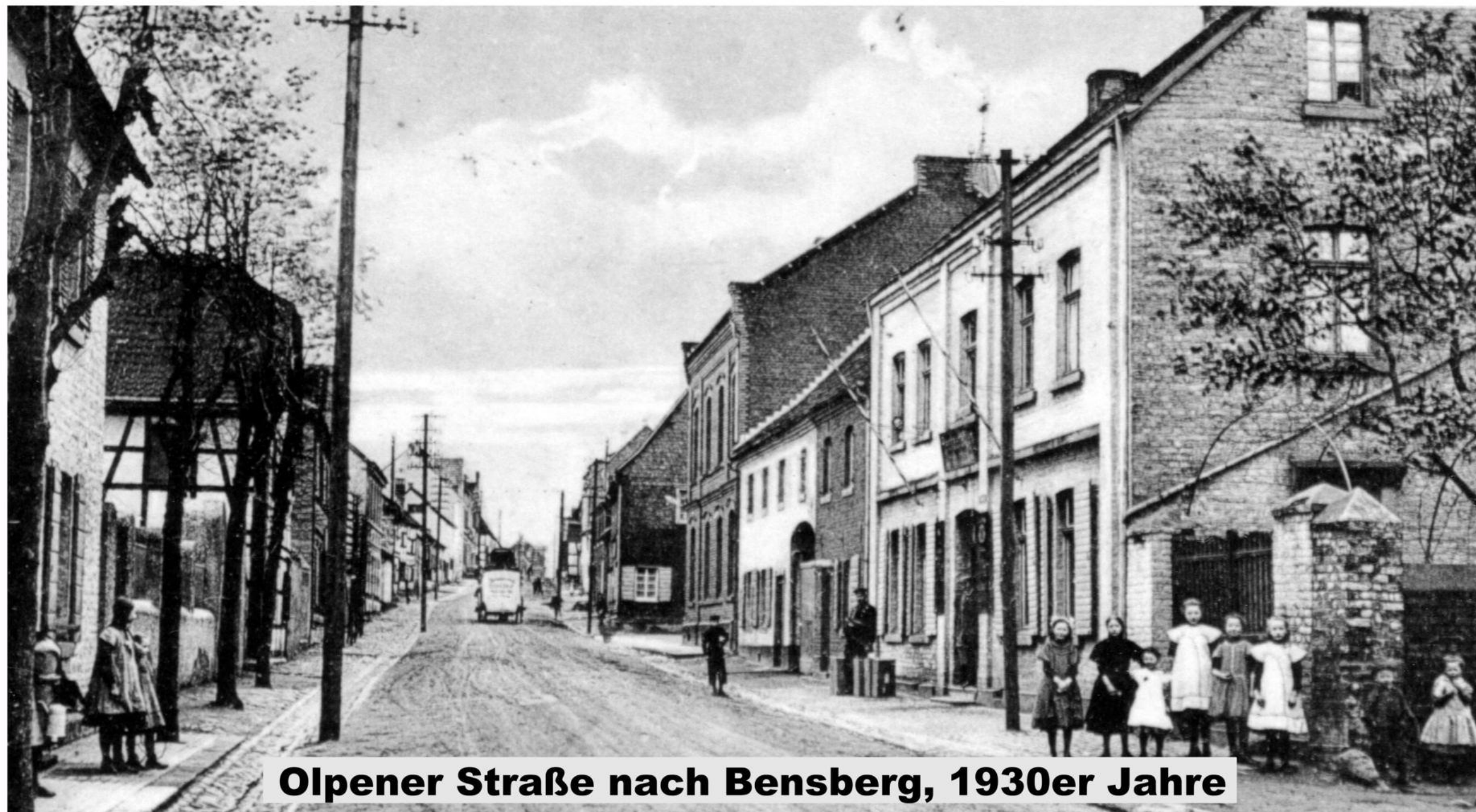
Olpener Straße nach Bensberg, 1930er Jahre