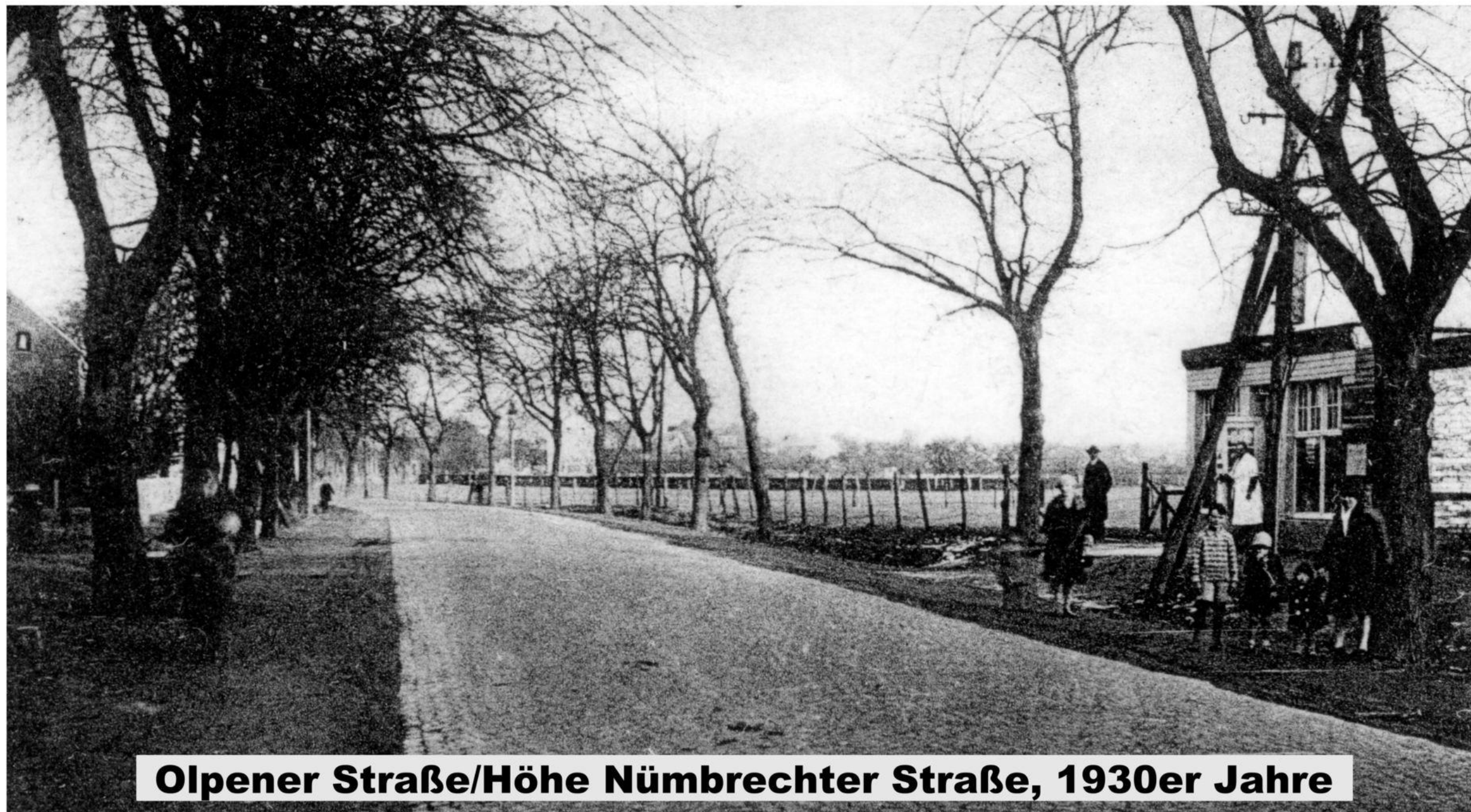
Olpener Straße/Höhe Nümbrechter Straße, 1930er Jahre